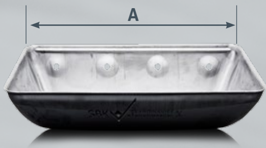
Koppens bredde Udvendige mål