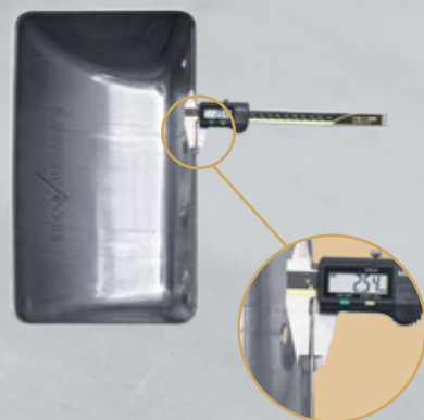
Tykkelsen måles med en skydelære